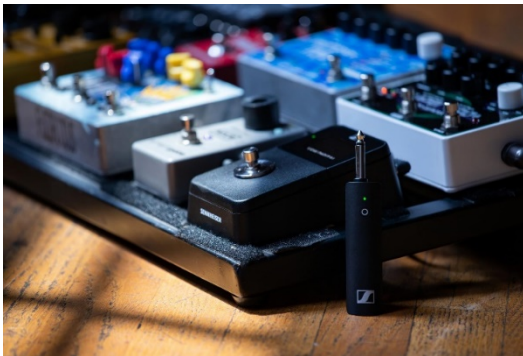
Le kit XSW-D Pedalboard Set inclut un tuner intégré pour guitare

Le kit XSW-D Portable Lavalier Set inclut un émetteur (mini-jack) avec clip de ceinture, un récepteur (mini-jack) avec câble de raccordement à la caméra et système de fixation et un micro-cravate ME 2-II.